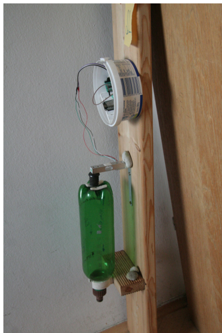
Slika 2: Slika rampe od strani